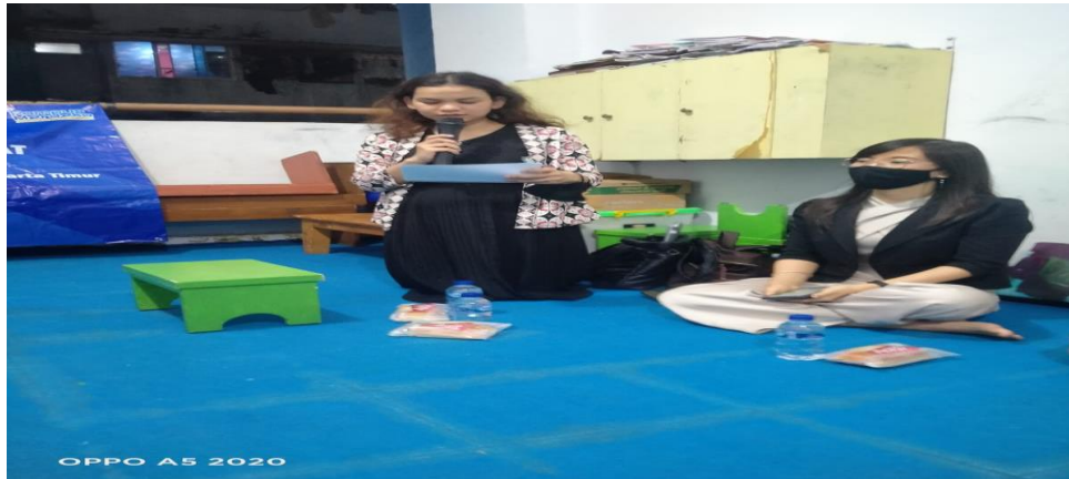
Gambar 3. Pemberian Materi Penyuluhan