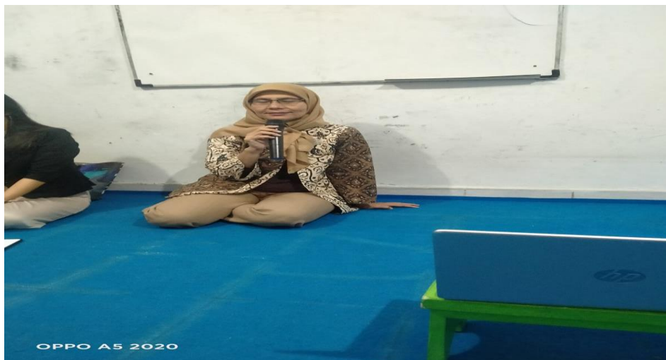
Gambar 4. Pemberian Materi Penyuluhan

Tahap 3 adalah evaluasi kegiatan dengan melakukan tanya jawab dan diskusi atas pemahaman materi penyuluhan. Pemaparan secara singkat mendapat respon yang antusias dari para peserta dengan pertanyaan yang muncul saat berlangsung sesi diskusi dan tanya jawab. Hal ini mengindikasikan bahwa materi yang diberikan telah sampai dan mulai dipahami oleh peserta.