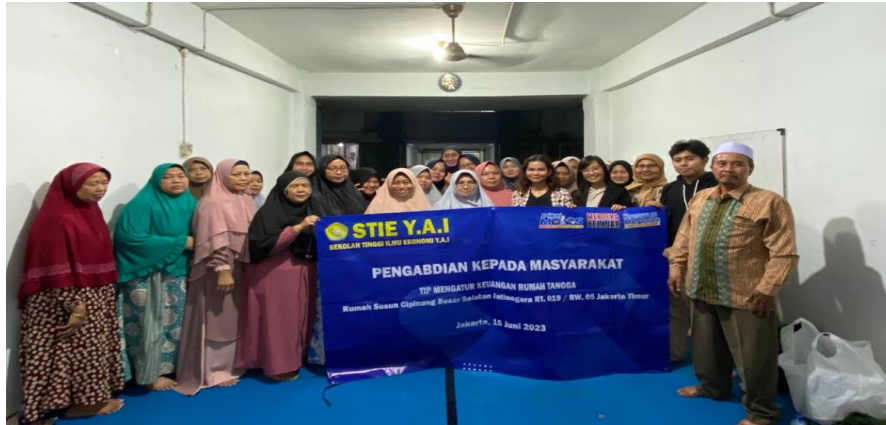
Gambar 7. Foto Bersama Ibu PKK dengan Tim PKM STIE Y.A.I Keberlanjutan Program.

Penyuluhan pengelolaan keuangan merupakan tahap awal dari peta jalan pemberdayaan masyarakat di rumah susun Cipinang Besar Selatan. Program selanjutnya adalah praktik pembuatan pencatatan sederhana bagi ibu-ibu PKK pelaku usaha UMKM. Selain itu keberlanjutan juga perlu dilakukannya praktik menggunakan teknologi digital dalam mencatat keuangan. Dengan demikian pemanfaatan teknologi digital tidak berhenti hanya pada pengetahuan dan manfaat saja.