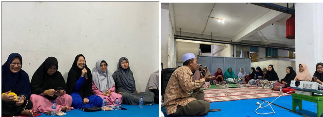
Gambar 5. Antusiasme Ibu-Ibu PKK Cipinang Besar Selatan melakukan diskusi.

Tahap 3 adalah evaluasi kegiatan dengan melakukan tanya jawab dan diskusi atas pemahaman materi penyuluhan. Pemaparan secara singkat mendapat respon yang antusias dari para peserta dengan pertanyaan yang muncul saat berlangsung sesi diskusi dan tanya jawab. Hal ini mengindikasikan bahwa materi yang diberikan telah sampai dan mulai dipahami oleh peserta.