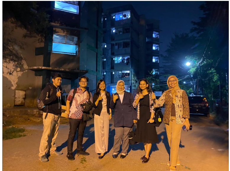
Gambar 1. Pra Kegiatan Kegiatan Kepada Masyarakat

Tahap 2 pelaksanaan kegiatan penyuluhan dilaksanakan pada tanggal 15 Juni 2023. Kegiatan dilaksanakan pada malam hari karena pada siang hari peserta masih bekerja. Dihadiri oleh 21 ibu-ibu PKK dengan kegiatan penyuluhan meliputi materi tentang mengembangkan keahlian digital dalam mengelola keuangan bisnis dan rumah tangga. Pada penyuluhan ini peserta diberikan materi tentang pemahaman dasar pengelolaan keuangan, pentingnya membuat pencatatan dan pelaporan keuangan. Juga tentang pemanfaatan teknologi digital dalam pencatatan dan pelaporan keuangan. Pembukuan dengan sistem komputerisasi dapat mencegah risiko kekeliruan yang bisa terjadi dalam akuntansi manual. Hal ini dikarenakan fokus dan ketelitian komputer lebih tinggi. Pentingnya pencatatan keuangan dengan sistem otomatisasi pada bisnis juga terlihat dari peningkatan kualitas dalam pekerjaan. Penggunaan system akan membuat bisnis menjadi semakin efisien dan menguntungkan