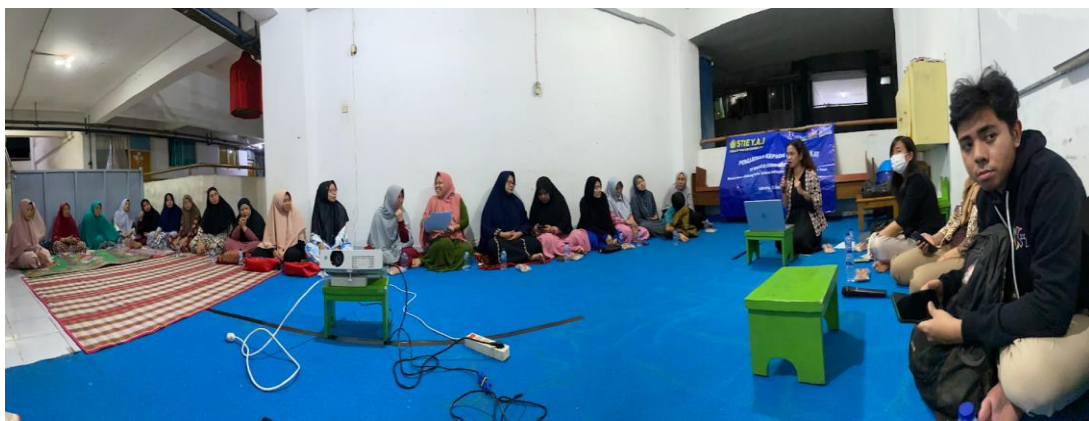
Gambar 2. Pemberian Materi Penyuluhan

Materi penyuluhan kedua adalah dan bagaimana cara mengatur keuangan rumah tangga dan membuat anggaran perbulan untuk menunjang usahanya. Pada materi ini penyuluhan ini berisikan tentang pentingnya mengatur keuangan dengan baik, dan tips agar keuangan terkelola dengan baik. Sehingga modal usaha tidak habis dikonsumsi tercampur dengan keuangan rumah tangga.